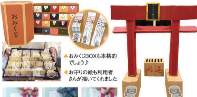
▲おみくじBOXも本格的でしょう！ ▲お守りの絵も利用者さんが描いてくれました

まずは1月の「お正月ウイーク」。本物さながらの鳥居やおみくじ箱を作り、デイケアに設置しました。利用者さんとスタッフが共同で作りましたおみくじやお守りをお詣りした方に差し上げました。