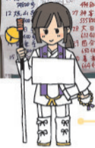
お遍路シールに自分の名前を入れて皆さん回っています。シールのイラストは利用者の方が描いてくださいました!!

皆さん、自身のスマートフォン・携帯電話や、デイケアから貸し出している歩数計を使って参加しています。デイケアが休みの日も、「まだ、これだけしか歩いてないから歩いて買い物に行こう」とか「家の中で、なるべく動くようにしている」と皆さんの意識も変わってきています。