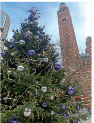
(上)ウェストミンスター大聖堂のクリスマスツリー (下)娘さんが発見した雪の結晶

まっています。また、車がなくて、できればバス移動は避けたいので、ほぼ半径10km圏内で過ごしています。このように、華やかなことはほとんど何もないわけですが、何か写真をとることで、冬至に撮ったロンドンの夕陽、ウェストミンスター大聖堂のクリスマスツリー、娘が発見した雪の結晶、そして報道されることはなかったが閉店が続くロンドンのパブをクマが占拠した衝撃的な事件をたまたま激写した写真をお送りしておきます。