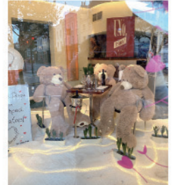
閉店する店が多くある中、ロンドンのパブを占拠したクマ

現在学んでいるのは、英国にある世界最大の遺伝子バンクのデータの解析方法などを教わっています。オンライン経由で私のパソコンを先生に操作してもらったりして、自宅で文字通り手取り足取り色々教えてもらっています。私は元々よからぬことをよく思いつくタイプで、日本ではそういうことを一部の人に対して以外は極力封印して過ごしていました。ところが、ロンドンでは思いついたアイデアをそのまま伝えたら結構面白がって採用してくれたりします。ですので、結果的には日本とあまり変わらない感じであると交流ができていますね。