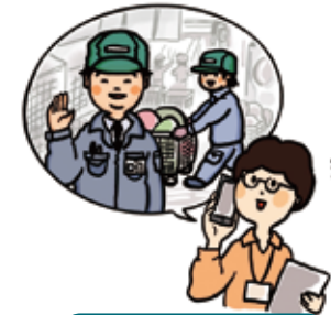
仕事や学校の相談