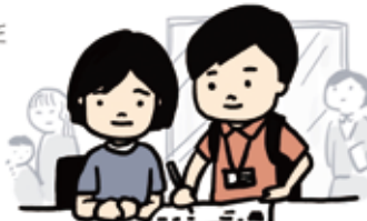
社会参加や福祉サービスの利用相談