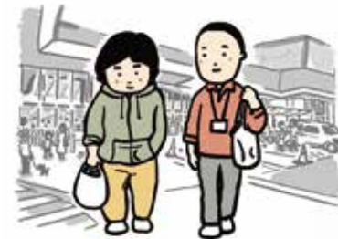
日常生活上の相談・援助