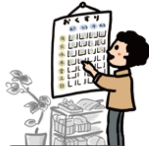
病気の症状やお薬についての相談