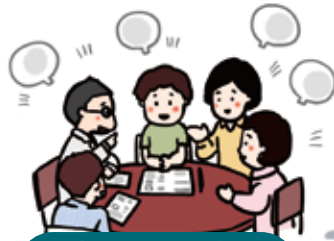
医療機関や地域との連携