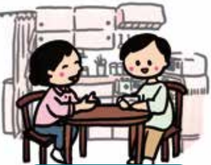
対人関係の困りごと相談