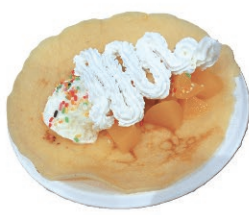
きれいに包めるかな?

は特別なレクリエーションとなりまして。実行委員会を立ち上げ、何をするから、買い出し、当日準備まですべて利用者さんが行ってくださいました。池田動物園、美観地区散策等の意見が出る中、最終的に選ばれたのは「パンケーキクレープ作り」でした。作製・トッピングともにセルフサービスだったため、参加された方は自分好みのパンケーキクレープを上手に作られていました。参加された皆さまが幸せそうに食べられていたので、見ているこちらも幸せでした。 このような楽しい思い出を今後も利用者さんと一緒に作っていったらと思います。