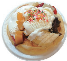
パンケーキトッピング全部のせ!

寒さが残りつつも、くしゃみの頻度や目の痒さから春の気配を感じる今日この頃、皆さまいかがお過ごしでしょうか。今年は、桜の開花が例年に比べ遅かったのですが、岡山市内の桜が咲いていないことも、デイケアの受付では鮮やかに咲いていました。 この冬から新しく「VRSSST」というプログラムがスタートしました。みなさんはVR体験をしたことがありませんか？思っていた以上に臨場感があり、楽しんで取り組むことができました。眼鏡をかけたままゴーグルを装着することができるとも驚きです。 毎月さまざまなレクリエーションを行っています。3月