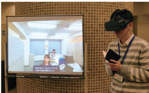
VRSSST (VRゴーグルを活用したソーシャルスキルトレーニング)の様子

寒さが残りつつも、くしゃみの頻度や目の痒さから春の気配を感じる今日この頃、皆さまいかがお過ごしでしょうか。今年は、桜の開花が例年に比べ遅かったのですが、岡山市内の桜が咲いていないことも、デイケアの受付では鮮やかに咲いていました。 この冬から新しく「VRSSST」というプログラムがスタートしました。みなさんはVR体験をしたことがありませんか？思っていた以上に臨場感があり、楽しんで取り組むことができました。眼鏡をかけたままゴーグルを装着することができるとも驚きです。 毎月さまざまなレクリエーションを行っています。3月