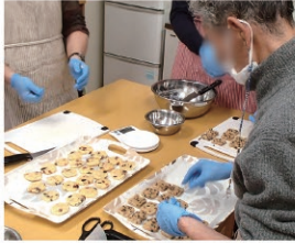
バレンタインのお返しに、感謝の気持ちを込めて…

小籠包・あんまんを提供しほっと一息つきお腹も温まりました。 また、ホワイトデーには、普段はお菓子作りに参加しない男性利用者さんを中心となりチョコクッキー作りをしました。捏ねる作業は力が必要でしたが、粘り強く丁寧な作業をし美味しいクッキーが出来上がりました。 そして、初チャレンジのオープン陶芸をしました。専用の粘土を用いて、1日目に成型、2日目に焼成・色塗りをしました。皆さん思い思いに小物入れや一輪挿しなどの作品を作りました。 診療所の庭も色とりどりの花で彩られ春を感じる今日この頃です。