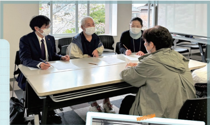
なんでも相談会の様子 (左から)行政書士、社会福祉士、社会保険労務士

弁護士、司法書士、行政書士、社会福祉士、精神保健福祉士、社会保険労務士、税理士、介護支援専門員 など