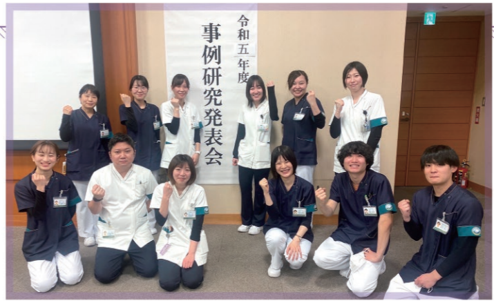
令和5年度 事例研究発表会

お問い合わせ NPO法人 岡山高齢者・障害者支援ネットワーク事務局 岡山市北区南方3丁目5番25号 TEL.086-222-0019 https://www.oka-siennet.org/